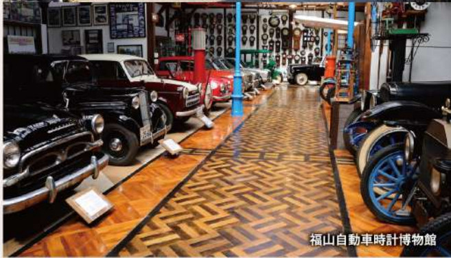
福山自動車時計博物館