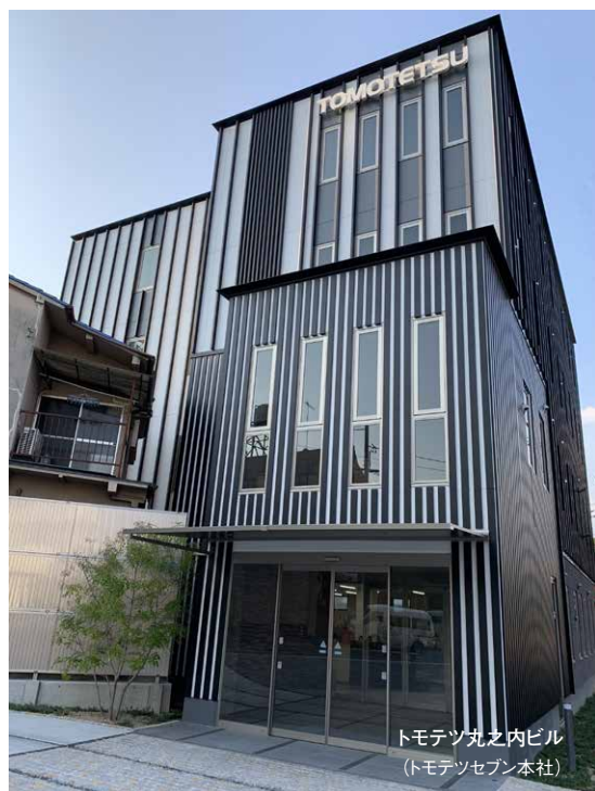
トモテツ丸之内ビル (トモテツセブン本社)