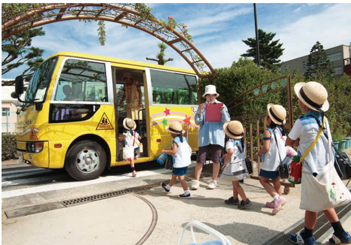
協力: 暁の星幼稚園様

2004年(平成16年)発足。自動車運行管理請負として、バス事業で培ったノウハウを活かし、車輛運行・車輛維持管理など、送迎ニーズをトータルにサポート。きめ細やかなサービスと、信頼あるトモテツブランドで安心・安全をお運びします。