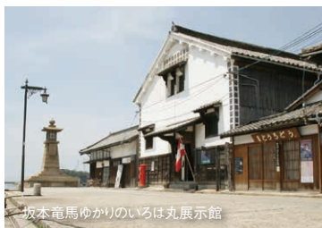
坂本竜馬ゆかりのいろは丸展示館

代表者 代表取締役社長 林 克士 事業内容 広告代理店事業 土産物販売事業(ともてつバスセンターの運営) 観光情報センターの運営 設立 1980年(昭和55年)4月 資本金 2,880万円 本社 広島県福山市丸之内二丁目9番1号 トモテツ丸之内ビル 事業所 ともてつバスセンター