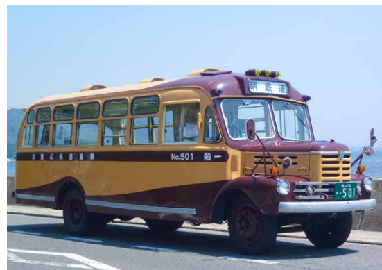
復刻ボンネットバス

福山市西部、尾道市、三原市を中心に路線バスを運行。通勤・通学・レジャー・生活に密着し、皆さまの足として、公共交通機関として安全な運行と親切で安心できるサービスを提供します。