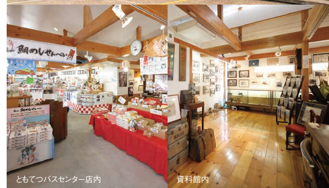
ともてつバスセンター店内